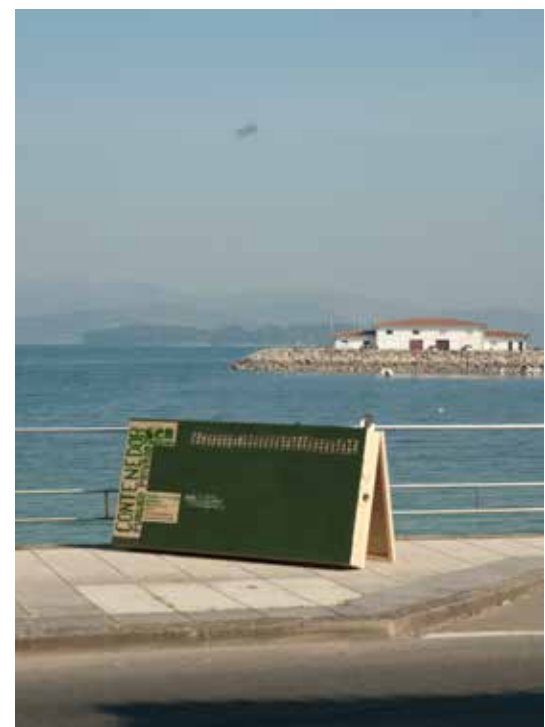
El contenedor dentro y fuera de una antigua conservera, cerrada durante los conflictos laborales de los 80 The container inside and outside of the former cannery fish factory closed during the work riots in the 80th