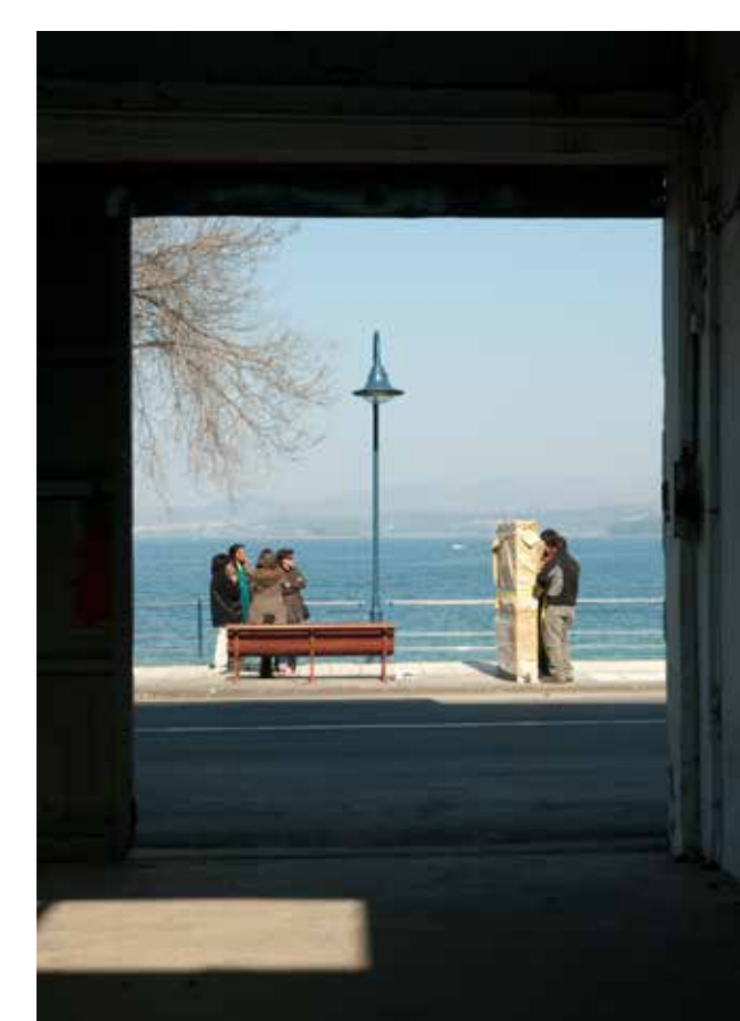
Después del encuentro se recoge el contenedor para llevarlo a otro lugar. Algunos de los datos recogidos se van a pintar de forma definitiva en la superficie de la pizarra y los materiales que las protagonistas han decidido se van a incorporar dentro del contenedor. En una segunda fase, el interior del contenedor también formará parte de todo el proceso, ya que se ha visto modificado por esta primera reunión o uso del contenedor.