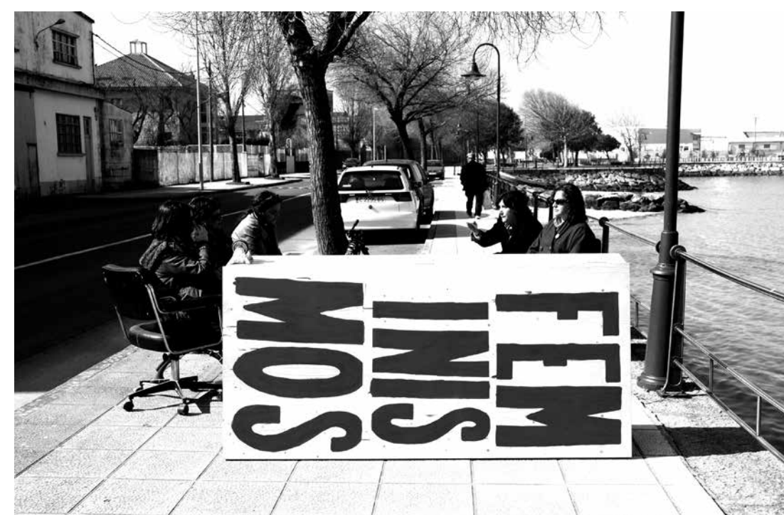
Reunión con algunas de las protagonistas de los encierros y las movilizaciones en contra de los cierres de las fábricas y la pizarra escrita con sus puntualizaciones sobre lo ocurrido. Meeting with some of the main figures of the sitings and the demonstrations against the close of the factories and detail of the written blackboard with their annotations about the events